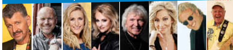
Semino Rossi, Olaf Henning, Stefanie Hertel, Nicole, Peter Orloff, Claudia Jung, Bernie Paul und Graham Bonney

Weitere Infos unter: www.schlager-kanaren.de