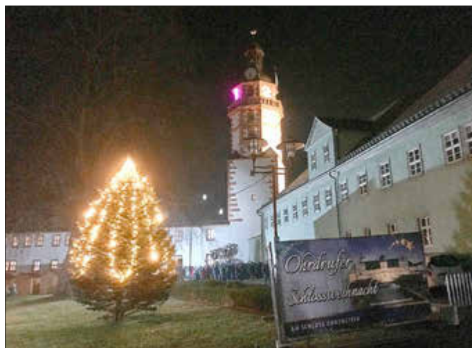
Schloß Ehrenstein im Weihnachtsgewand

Wir freuen uns auf diese Fahrt mit Euch/Ihnen!