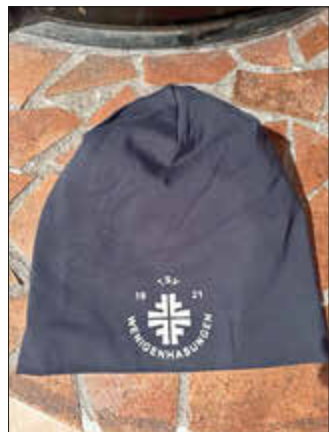
So sehen die Beanies mit TSV-Logo aus

Vom 5. bis 10. Januar 2024 fahren wir mit Roger Neusel im Reisebus nach Vorderlanersbach ins Tuxer Tal. Am 24./25.8.2024 fahren wir - ebenfalls mit Roger - zur Sandkerwa nach Bamberg. Wer bei einer dieser Touren mitfahren möchte kann sich gerne an Matthias Pflüger für weitere Informationen wenden.