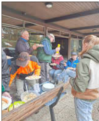
Leckeres Buffet vom „Schnuddelcafé“

Am Samstag den 28. Oktober haben trotz der kurzfristigen Bekanntgabe rund 20 Freiwillige tatkräftig den Friedhof auf Vordermann gebracht. Es wurde insbesondere Rasen gemäht und die sehr lange Hecke geschnitten. Das Wetter hat überwiegend mitgespielt und die Pausenzeit durch den Regenschauer vorgegeben. Gut, dass das „Schnuddelcafé“ schon das Essen vorbereitet hatte. So konnte die Regenschauer-Pause gut genutzt werden. Der Friedhofs-ausschuss bedankt sich herzlich für die großartige Unterstützung der Helfer und die leckere und gemütliche Ausrichtung der Mittagspause.