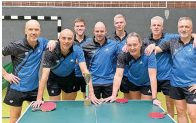
Großkampftag in Zierenberg am Samstag, 18. November, ab 18 Uhr in Zierenberg. Auch die Erste ist mit dabei. Kommt vorbei in Zierenberg!