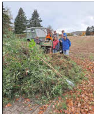
Ein Teil der fleißigen Helfer und Helferinnen

Im nächsten Jahr wird es voraussichtlich zwei Termine geben, die zu Jahresbeginn festgelegt werden sollen. Auf Grund von Beerdigungen kann es dennoch jederzeit zu kurzfristigen Verschiebungen kommen. Damit das Hecke schneiden zukünftig einfacher und somit schneller von statten geht, versucht unser Ortsvorsteher die lange Hecke auf eine Einheitshöhe schneiden zu lassen.