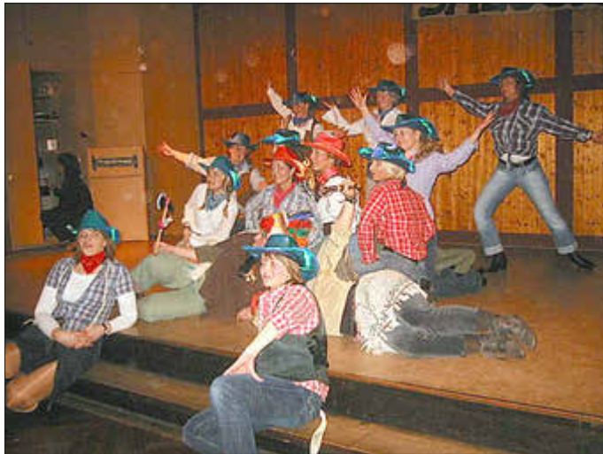
Mitreibende Tänze und bunte Outfits, wie hier 2009, stehen demnächst bei der Nacht des Sports wieder an

Runter vom Sofa und auf zur TSV Fitness, liebe TSVer*innen und solche, die es werden wollen...!