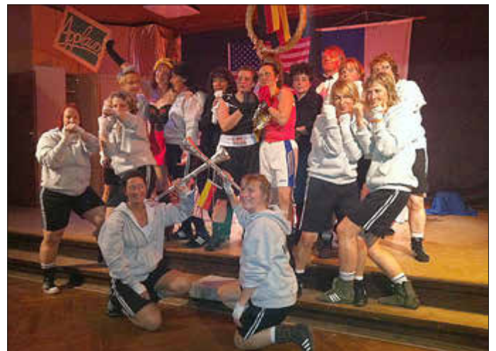
... und so bunt sah die Nacht des Sports in 2012 aus.

14. April: Rad Tour zur Schwimmbad-Eröffnung in Wolfhagen, 04. Mai Nacht des Sports, 09. Juni TSV Radtour im Rahmen von BONWAI, 09. Mai Familien-(Wandertag) zum Vatertag in Istha, 20. Juli Viehmarktumzug „Wir sind Wolfhagen“ mit Auto und Laufgruppe Crazy Steps sowie Streetdance, 24. bis 25. August Vereinsfahrt zur Sandkerwa nach Bamberg, 22. September: Sportkreiswandertag Bründersers.