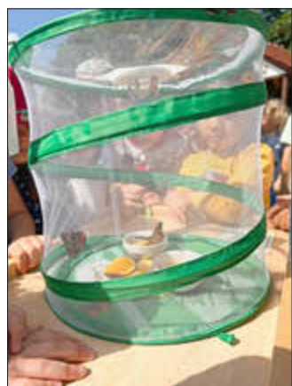
Unsere Distelfalter kurz vor dem Abflug

Die Kita Liemecke ist spielzeugfrei, und somit ist viel Zeit, um heranwachsendes Leben zu beobachten. Einige unserer jüngsten Kita-Kinder zeigten großes Interesse an Schmetterlingen. So widmete sich die Gruppe „die Füchse“ begeistert der Frage, wie Schmetterlinge entstehen. Alle Kinder hatten die Gelegenheit, den Wachstumsprozess von Raupen hautnah zu erleben.