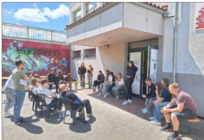
Das Team für die Ferienspiele 2024 - Vorstellung der Programmpunkte

Nachdem die Betreuerinnen und Betreuer der diesjährigen Ferienspiele für das erste Vorbereitungstreffen bereits am 30.04. zusammen saßen, stand am 25.05. die nächste wichtige Etappe an: eine umfassende Fortbildung.