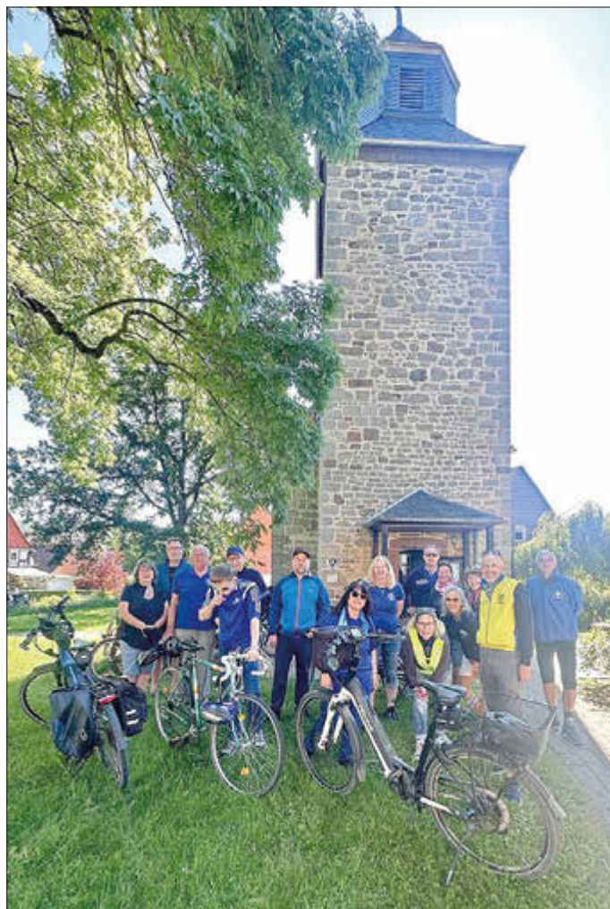
Ein idyllisches Motiv mit unseren TSV-Radlern vor der Wenigenhasunger Dorfkirche

Für Richtigkeit und Inhalt der eingereichten Berichte ist der jeweilige Verfasser verantwortlich.