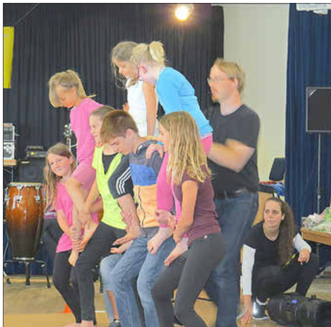
Kinder Akrobatik gegen 15 Uhr