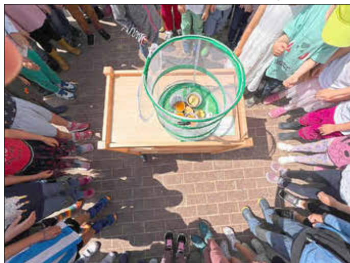
Viele Füße warten auf den Abflug

Wir hatten dafür vier Raupen bestellt, die sich innerhalb von vier Wochen zu Distelfaltern entwickeln. Diese Raupen wurden in einem speziellen Behälter mit integriertem Futter untergebracht. Wir bekamen von einer Mutter auch 25 kleine Miniraupen, die wir selbst mit Apfelblättern füttern dürfen. So beobachteten wir, wie die Raupen von Tag zu Tag wuchsen. Unsere Distelfalterraupen verpuppten sich im Mai und schlüpfen 14 Tage später als wunderschöne Schmetterlinge. War das eine Freude, die vier entwickelten Schmetterlinge im Garten fliegen zu lassen. Wir winkten ihnen lange hinterher.