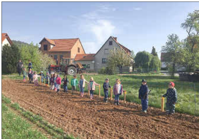
Die Kartoffeln sind in der Erde

Es ist eine große Bereicherung für unsere Kita-Kinder, sich immer mal wieder von Experten oder Expertinnen aus dem sozialen Umfeld für die unterschiedlichsten Themen begeistern zu lassen, denn nur was man mit Begeisterung lernt, ist langfristiges und effektives Lernen und bleibt somit als Erfahrung und Wissen im Hirn hängen.