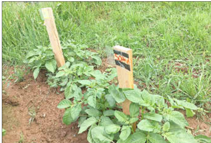
Unsere Kartoffeln sind schon richtig gut gewachsen

bis Kartoffeln als leckere Beilage auf unserem Teller sind. Mit diesem Wissen und diesen Erfahrungen lernen sie wie von selbst, mit der Natur und ihren Erzeugnissen sorgsam und wertschätzend umzugehen.