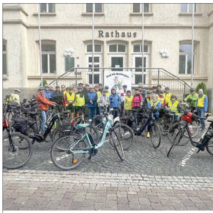
TSV bei der Stadtradeln-Abschluss-Tour