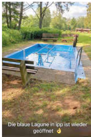
Die blaue Lagune in Ipp ist wieder geöffnet 🏊

Ein Geheimtipp ist das Tretbecken am Angelzentrum. Ein Kneippbecken ist ein spezielles Wasserbecken, das für das sogenannte Wassertreten nach Sebastian Kneipp konzipiert wurde. Die Wasserhöhe beträgt in der Regel etwa 30 bis 40 Zentimeter, was ausreicht, um bis knapp unter die Knie zu reichen. Der Boden des Beckens ist rutschfest gestaltet, um ein sicheres Begehen zu ermöglichen.