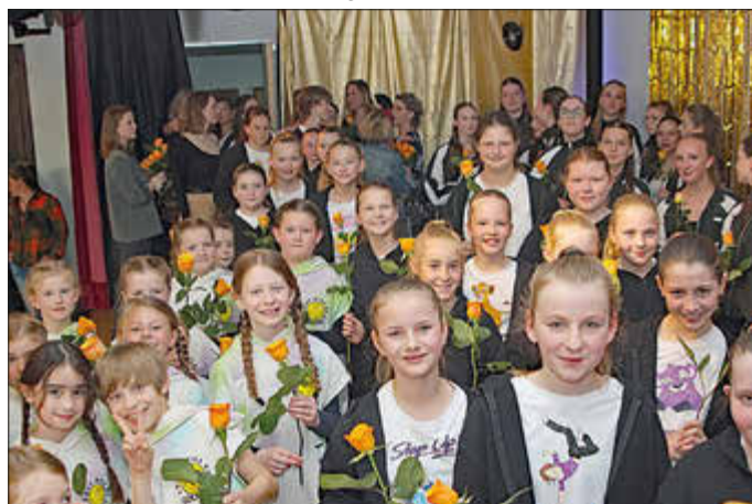
Die Streetdancer*innen des TSV bei der Nacht des Sports im Mai

Gegen 13 Uhr findet die Siegerehrung für den Stadtradeln-Wettbewerb teil. Hier waren die Wenigenhasunger fleißig und dürfen sich auf einen Preis vom Bürgermeister freuen.