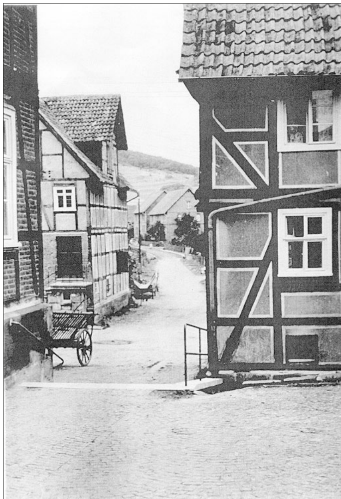
Alte Ansicht Kirchplatz um 1950