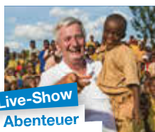
Live-Show Abenteuer Weltumrundung