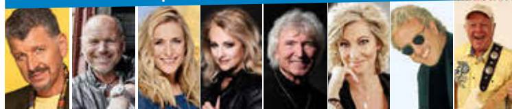
Semino Rossi, Olaf Henning, Stefanie Hertel, Nicole, Peter Orloff, Claudia Jung, Bernie Paul und Graham Bonney