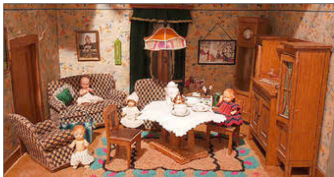
Wohnzimmer der Puppenstube im Regionalmuseum

Puppenstuben waren ab dem Beginn des 19. Jahrhunderts ein beliebtes Spielzeug, welches Kinder sowie Erwachsene erfreute. Es galt eine Welt zu schaffen, die realitätsnah und vorbildlich war. Mit Liebe und Akribie wurde gebaut, tapeziert und eingerichtet. So zeugt die Welt im kleinen Format von hoher Kreativität von Groß und Klein. Webteppiche wurden ebenso in mühevoller Arbeit hergestellt wie Gardinen oder auch Einrichtungsgegenstände. Tapetenfirmen gaben Spezialkarten für Puppenstuben heraus und Spielzeughersteller entwarfen Möbel nach neuestem Geschmack. Die Einrichtungstrends und Möbelstile wurden sofort nachgebaut. Die historistischen Möbel der Gründerzeit mit ihren opulenten Formen sind ebenso wiederzufinden wie die Stahlrohrmöbel des Bauhauses der 1920/30er Jahre. Sabine Thümmler, die als ehemalige Leiterin des Tapetenmuseums in Kassel und Direktorin des Kunstgewerbemuseums Berlin eine ausgewiesene Kennerin des Interieurs ist, stellt die Puppenmöbel aus dem Wolfhager Regionalmuseum vor und führt in ihren Vortrag durch die Einrichtungsstile des ausgehenden 19. Jahrhunderts bis in die Moderne. Sie zeigt mit Vergleichen zu historischen Möbeln und Interieurs wie verblüffend genau die Puppenwelt die Realität nachstellte und zudem geschmacksbildend wirken sollte.