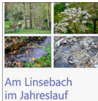
Am Linsebach im Jahreslauf