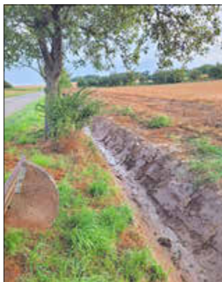
Graben an der Apfelallee

In der Apfelallee im Ziegelbruchweg ist der Bauhof aktuell ebenfalls fleißig: Die Gräben sind bereits wieder geöffnet und das Drainagerohr ist gespült. Außerdem wurde das Loch in der Straße wieder geschlossen. Somit sollte das Wasser wieder abfließen können und nicht mehr für einen kleinen Bachlauf auf der Straße sorgen. Die Aus-