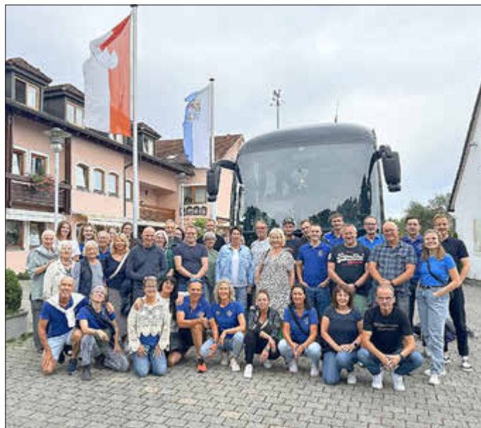
Unser Foto zeigt die TSV-Aktiven in Bamberg beim Hotel

Ein unterhaltsames Fischerstechen, eine wunderbare Altstadt, herzliche Menschen