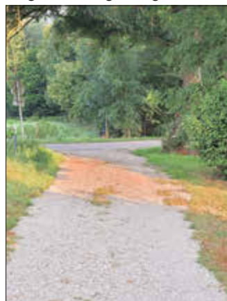
Neuer Schotter an der Walme

Wer nach der fantastischen Kirmes einen Spaziergang über die Walme gemacht hat, hat es bereits gesehen: am unteren Ende wurde Schotter verteilt. Dadurch bleibt die Walme nun auch bei Regenwetter gut begehbar.