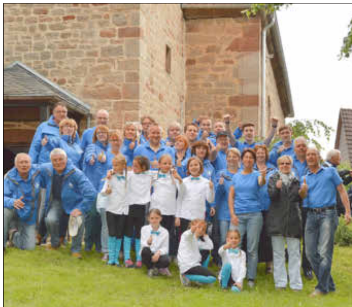
Es war 2016: Da bekamen unsere Sportler vom TSV neue Trainingsanzüge.