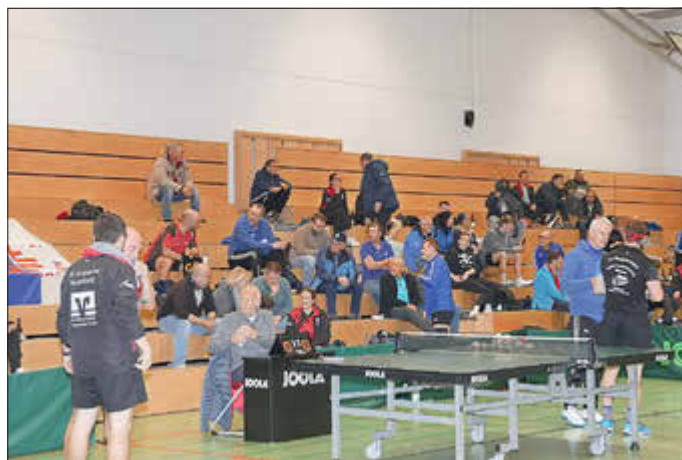
Impression vom Tischtennis Gesamtspieltag in Zierenberg. Coaching im letzten Einzel.