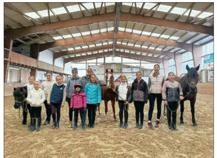
Reitschülerinnen mit Schulponys

Der gesamte Tag wurde zu einem fröhlichen und verbindenden Erlebnis für Mitglieder, Freunde und Unterstützer des Vereins, das die stolze Geschichte und die Gemeinschaft des Reit- und Fahrvereins Wolfhagen gebührend in den Mittelpunkt stellte.