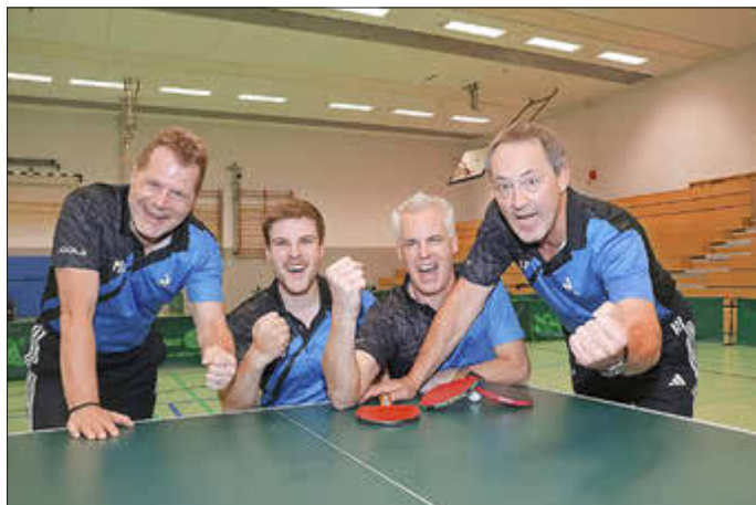
Impression vom Tischtennis Gesamtspieltag in Zierenberg. Die Erste.

- Freitag 17.30 Uhr TT Kindertraining Sporthalle: Unter Anleitung unseres erfahrenen Trainerteams sind alle Nachwuchstalente, vom Anfänger bis Mannschaftspieler, in guten Händen und können Ihr Geschick mit dem kleinen Ball stetig verbessern. Das Training findet immer freitags von 17:30 - 19:00 Uhr in Wenigenhasungen statt. Neugierige sind immer gern gesehen.