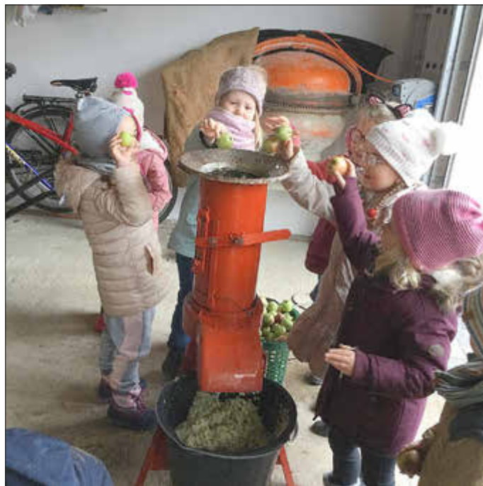
Äpfel schreddern macht Spaß