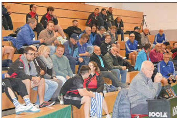
Impression vom Tischtennis Gesamtspieltag in Zierenberg. Eine tolle Stimmung.

Mit sportlichen Grüßen für den TSV Wenigenhasungen