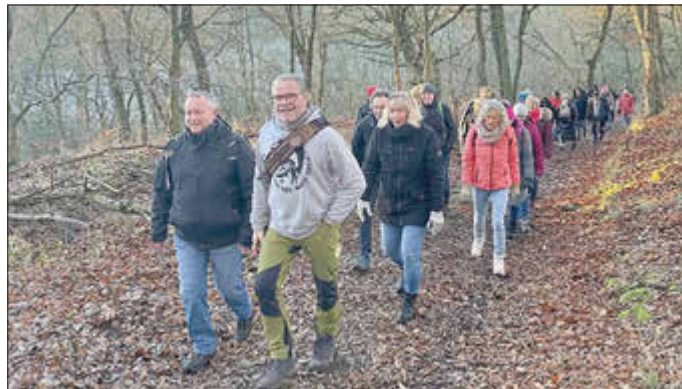
Sonnenschein gab's zur Belohnung bei der TSV Winterwanderung nach Burghasungen und Oelshausen