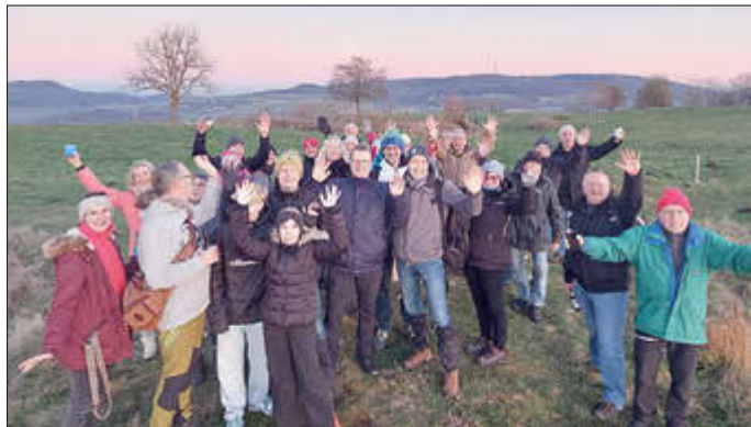
Das Highlight der TSV-Winterwanderung: Der Sonnenuntergang am Burghasunger Berg gesehen.