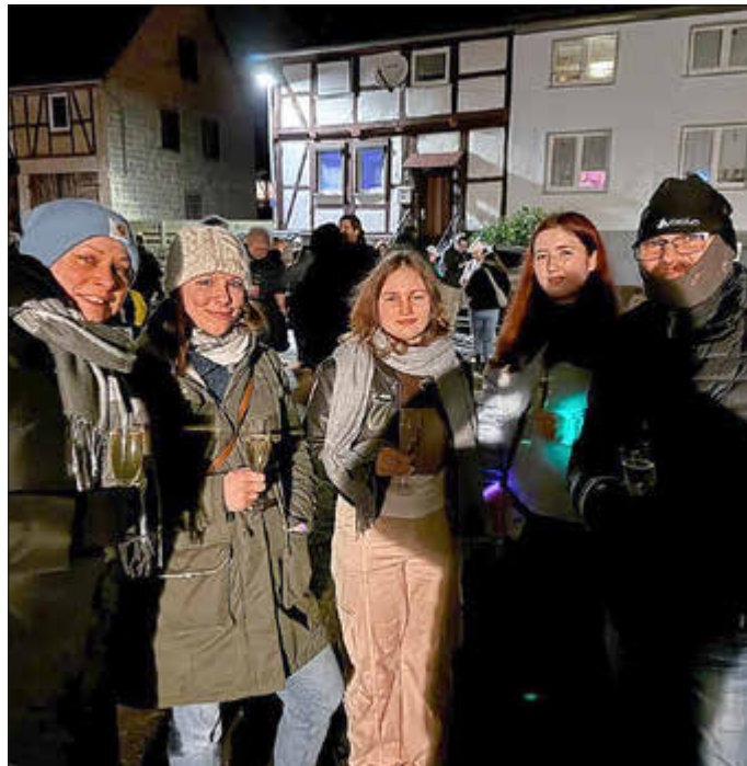
Neujahrsektempfang anlässlich des Dorfjubiläums

In der Silvesternacht wurde den Niederelsungen wieder einiges geboten: neben einem fantastischem Feuerwerk für das ganze Dorf , haben sich circa 200 Menschen zur gemeinsamen Einstimmung in des Jubiläumsjahr getroffen und mit einem Glas Sekt gemeinsam das Feuerwerk geschaut.