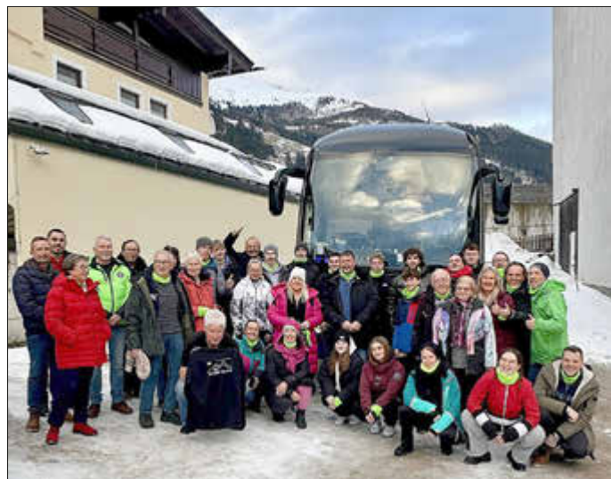
35 Wintersportler vom TSV Wenigenhasungen waren auch in diesem Januar wieder in Tux in Österreich.

Einladung zur JHV für 2024 am 18.1.2025 im Bürgertreff - dieses mal bereits ab 19 Uhr!