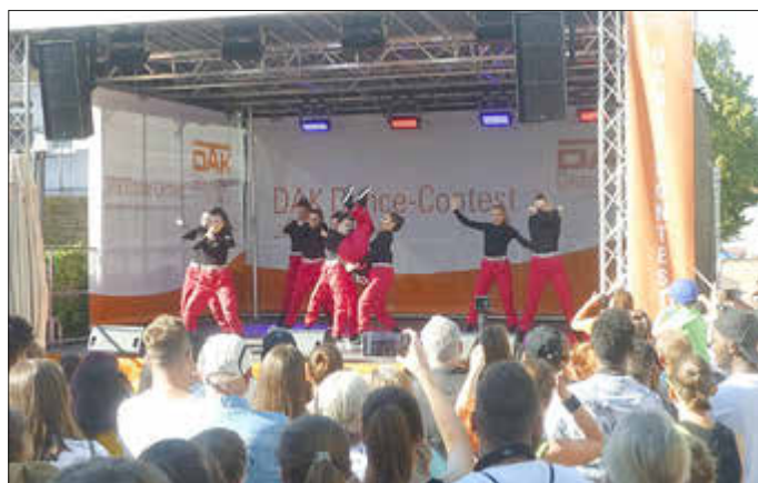
TSV Streetdancer*innen ein Jahr später ... in 2019