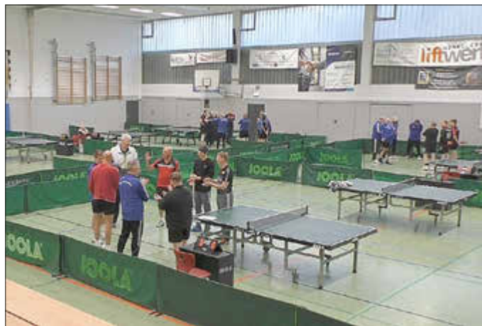
TSV-Tischtennis Großspieltag in Zierenberg

Es war erneut ein schönes Gemeinschaftserlebnis, der Tischtennis Großspieltag in Zierenberg. Acht Teams mit insgesamt 33 aktiven Tischtennispielern zeigten vor ca. 40 Zuschauern ihre Leidenschaft für den Sport mit dem kleinen Plastikball. Es gab sehenswerte Ballwechsel und viel Leidenschaft. Am Ende standen in den Begegnungen der vier Wenigenhasunger Teams gegen die Gäste vom SV Harleshausen Kassel, Sportclub Niestetal, TSV Eintracht Naumburg und dem TSV Breuna lediglich zwei Punkte aus den Remis der dritten sowie vierten Mannschaft. Aber ganz ehrlich: Das war nur bedingt wichtig. Viel schöner war das gemeinsame Erlebnis im Spiel und anschließend beim gemütlichen Beisammensein in der Zierenberger Großsporthalle. Berichte zur TSV-Jahreshauptversammlung