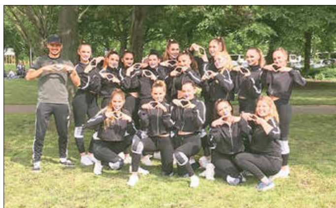
TSV Streetdancer*innen in 2028