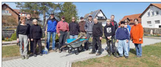
Einige freiwillige Helferinnen und Helfer in Wenigenhasungen