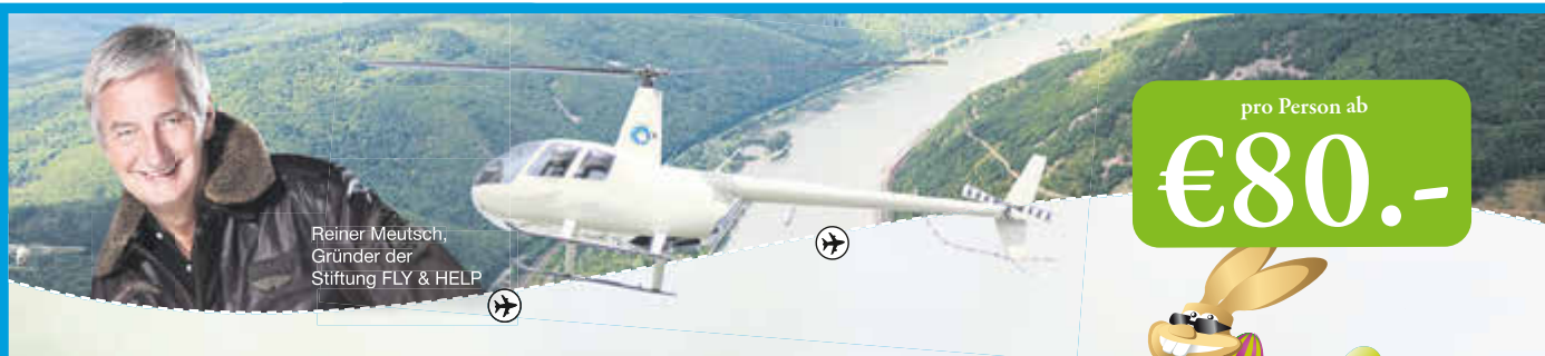
Reiner Meutsch, Gründer der Stiftung FLY & HELP