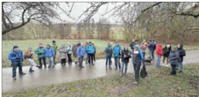
TSV-Jahresabschluss 2025, die Winterwanderung