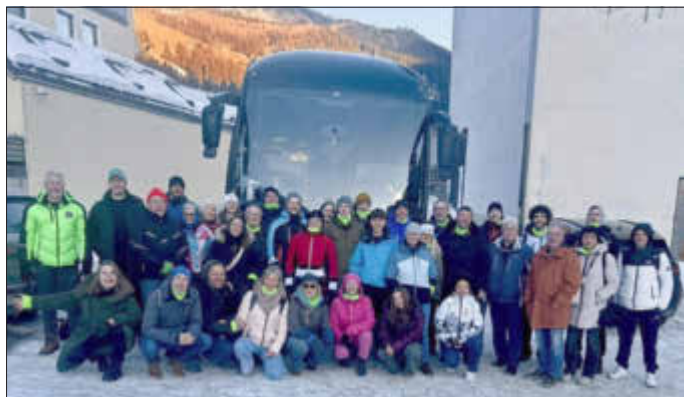
Die TSV Skifahrer in Tux

Besuch der 271. Erlanger Bergkirchweih, „Last Odors“ um 23 Uhr. Sonntag Frühschoppen, ca. 16 Uhr Heimreise. Preis 139 € pro Person Doppelzimmer, EZ 179 €. Hotel Bayrischer Hof Erlangen. Orga Info & Anmeldung N-Ele-Tours, Roger Neusel, Tel. 05673/912025.