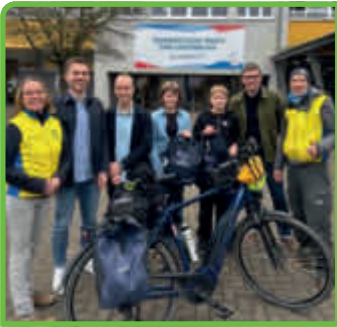
Walter-Lübcke-Schule radelt mit Wolfhagen auf Platz drei S. 7.