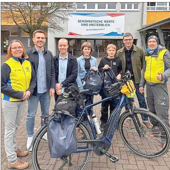
Beim Stadtradeln-Wettbewerb vom 25.5. bis 15.6.2025 hat die Stadt Wolfhagen unter 19 teilnehmenden Kommunen im Landkreis den