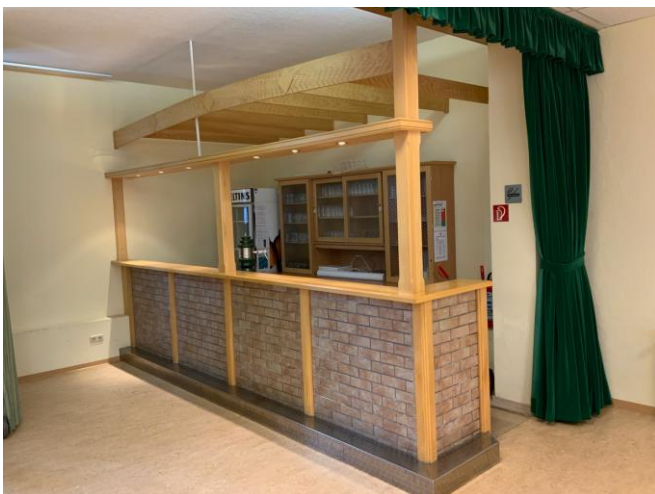
Theke mit Kühlung und Zapfanlage