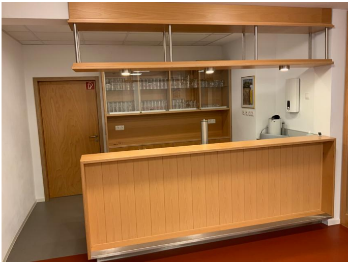
Theke mit Kühlung und Zapfanlage