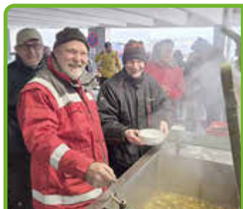
Aktionstag „Sauberes Wolfhagen“ fand wieder großen Anklang S. 2