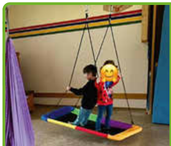
Neue Ganzjahres-schaukel in der KiTa Liemecke S. 11