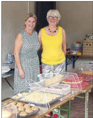
Selbstgebackene Kuchen im Angebot des Fördervereins.

Freier Eintritt ins Erlebnisbad Wolfhagen am Sonntag, 12. April 2026 Schnupperangebote nutzen und 10 % Rabatt auf Saisonkarten sichern!