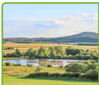
Geführte Wanderung durch das Naturschutzgebiet Glockenborn am 12.04.26 S. 23